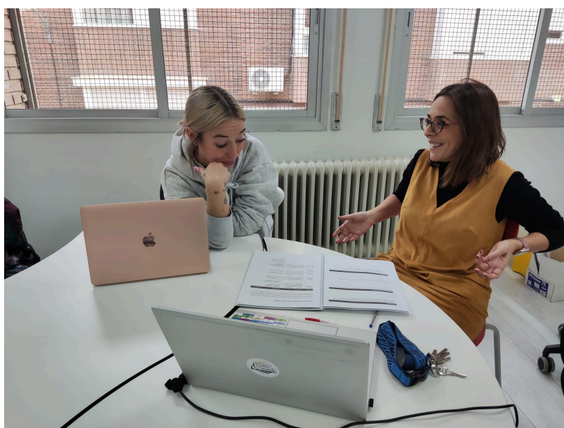
Imagen durante una sesión de mentoría entre docentes